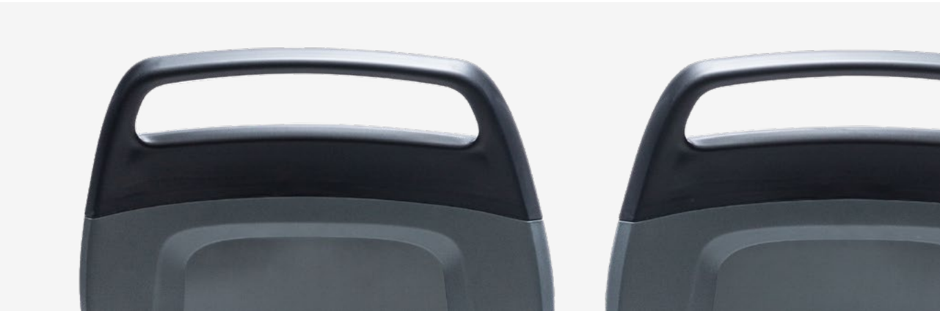
Kinnschutz, optional mit Haltegriff Chin protection, with optional grab handle