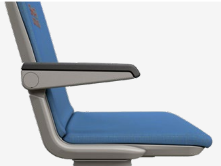
Klappbare Armlehne Foldable armrest