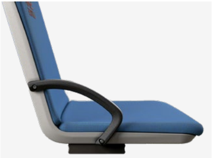
Abweisbügel Hip restraint