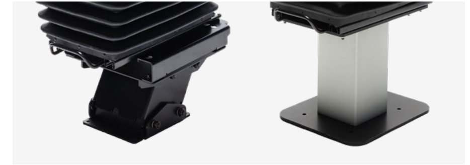
Unterbau mit Schwenkadapter oder Statiksäule (optional) Substructure with swivel adapter or static column (optional)