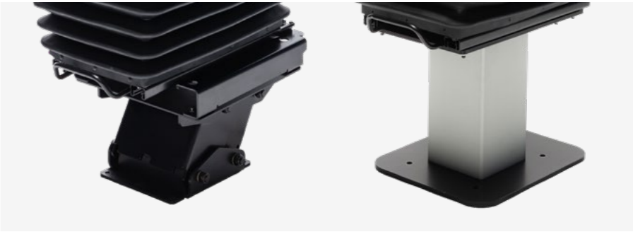
Unterbau mit Schwenkadapter oder Statiksäule (optional) Substructure with swivel adapter or static column (optional)